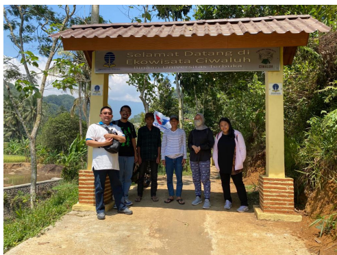
Gambar 2.3 Gapura Identitas Masuk Ekowisata