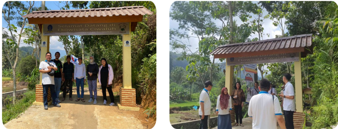
Gambar 2.6 Gapura identitas masuk ekowisata Ciwaluh

Gapura yang dibuat bukan hanya sebagai bangunan fisik saja namun lebih memiliki fungsi dan arti tersendiri sebagai pintu gerbang serta identitas maupun tanda batas untuk wisatawan yang memasuki Kampung Ekowisata Ciwaluh. Menurut tradisi, gapura merupakan wujud ungkapan selamat datang kepada tamu/pengunjung yang akan berkunjung ke tempat tersebut. Disisi lain gapura tersebut dibangun sebagai visualisasi keindahan. Keindahan disini adalah wujud dari penataan sebuah tempat yang akan terlihat berbeda antara yang ada pintu gerbangnya dan yang tidak ada, ada kesan lain, dan lebih mencerminkan sebuah destinasi wisata. Dengan adanya gapura tersebut, wisatawan lebih dimudahkan untuk memasuki Kampung Ekowisata Ciwaluh.