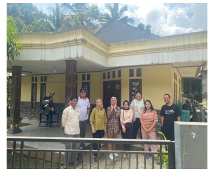
Gambar 2.1 Perencanaan dan Observasi