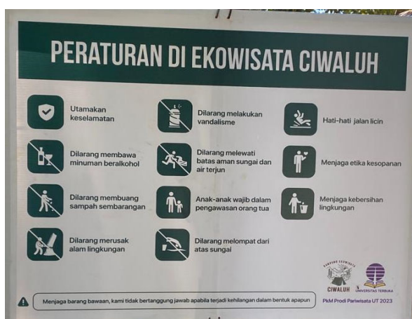
Gambar 2.4 Papan Peraturan untuk Pengunjung Ekowisata