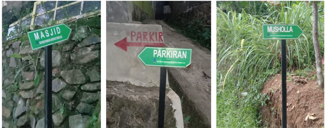
Gambar 2.5 Papan petunjuk arah ekowisata Ciwaluh

Petunjuk arah dibuat sebagai sarana sebagai media informasi agar para pengunjung suatu objek wisata tidak kebingungan dalam mencari jalan atau menuju kepada titik-titik penting lokasi yang ingin dikunjungi oleh wisatawan. Bukan hanya sekedar pelengkap atau formalitas, petunjuk arah merupakan media visual yang sangat penting di dalam menyampaikan informasi mengenai suatu arah tujuan. Umumnya petunjuk arah memiliki dua unsur yaitu simbol dan huruf. Dua simbol pokok ini dapat saja tidak dipergunakan salah satunya akan tetapi sangat baik jika dipergunakan bersamaan. Kedua unsur ini akan mempertegas sekaligus mempermudah pemahaman bagi masyarakat di dalam mempersepsikan simbol dan huruf ke arah mana tujuan perjalanan mereka 3