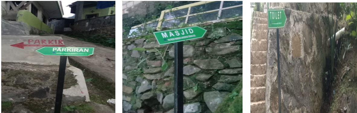
Gambar 2.2 Papan petunjuk arah di luar dan di dalam Ciwaluh

Setelah melakukan koordinasi dengan pokdarwis Kampung Ekowisata Ciwaluh serta melakukan identifikasi dan pemetaan masalah maka dihasilkan produk dalam pengabdian masyarakat ini sebagai berikut.