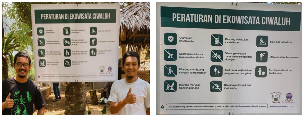
Gambar 2.7 Papan peraturan pengunjung ekowisata Ciwaluh