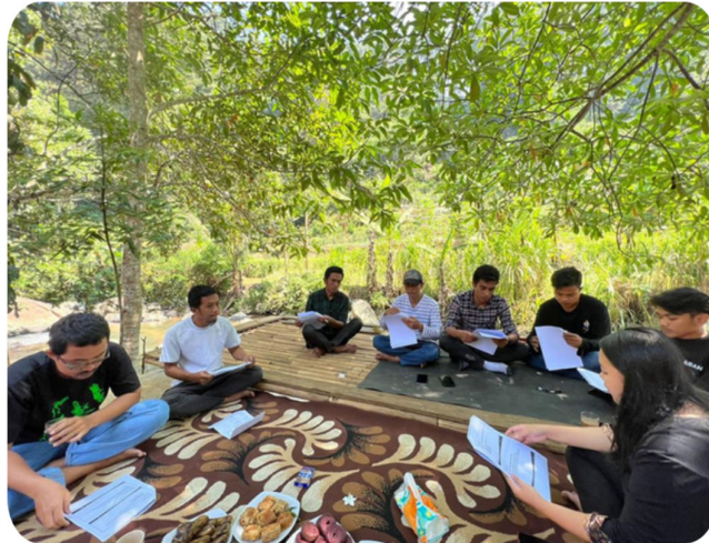
Gambar 2.8 Pelatihan cara merawat sarana prasarana di ekowisata

Pelatihan cara merawat sarana prasarana di Kampung Ekowisata Ciwaluh merupakan salah satu kegiatan tim PkM Universitas Terbuka dalam membantu pengurus Kampung Ekowisata Ciwaluh dan Pokdarrwis agar dapat melakukan fungsi perawatan terhadap sarana dan prasarana yang dimiliki. Perawatan merupakan hal yang wajib dilakukan terhadap fasilitas yang ada agar dapat berfungsi secara maksimal dan memiliki umur operasional yang panjang. Untuk dapat melakukan proses perawatan diperlukan sumber daya manusia yang memiliki kemampuan dan pengetahuan tentang bagaimana cara merawat sarana dan prasarana, sehingga diperlukan adanya pelatihan untuk mendukung hal tersebut. Pengabdian Kepada Masyarakat yang dilaksanakan di