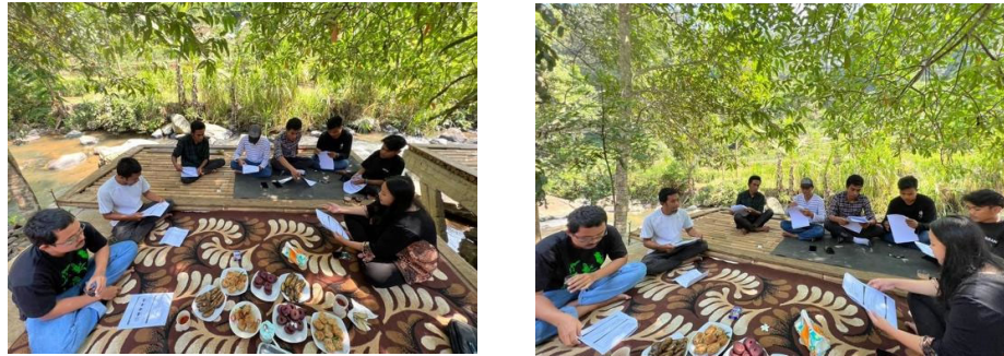
Gambar 2.2 Pelatihan Perawatan Sarana Prasarana