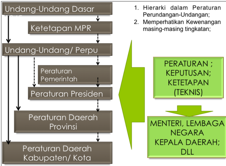
Gambar 1.3 Hierarki Peraturan Perundang-undangan