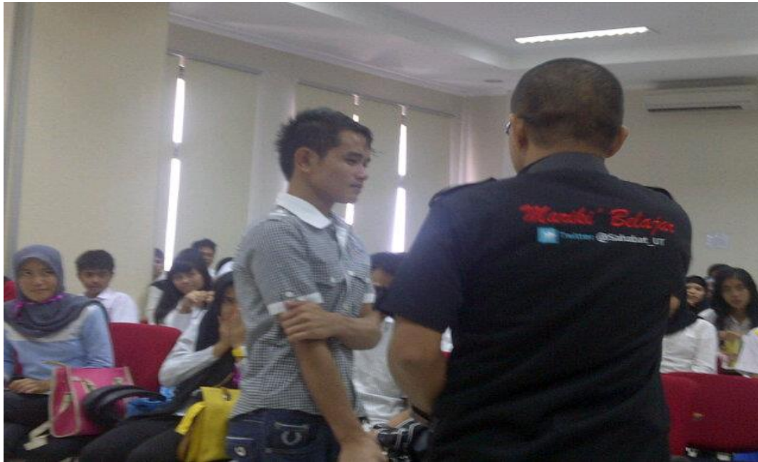
Gambar 4-1 @Sahabat_UT pada Baju Kerja

Untuk mempopulerkan layanan dukungan akun twitter @UT_Makassar dilakukan berbagai upaya, antara lain: mensosialisasikannya pada saat OSMB, membuat link pada website UT Makassar, dan menjadi atribut pada pakaian kerja, seperti terlihat pada Gambar 4-1.