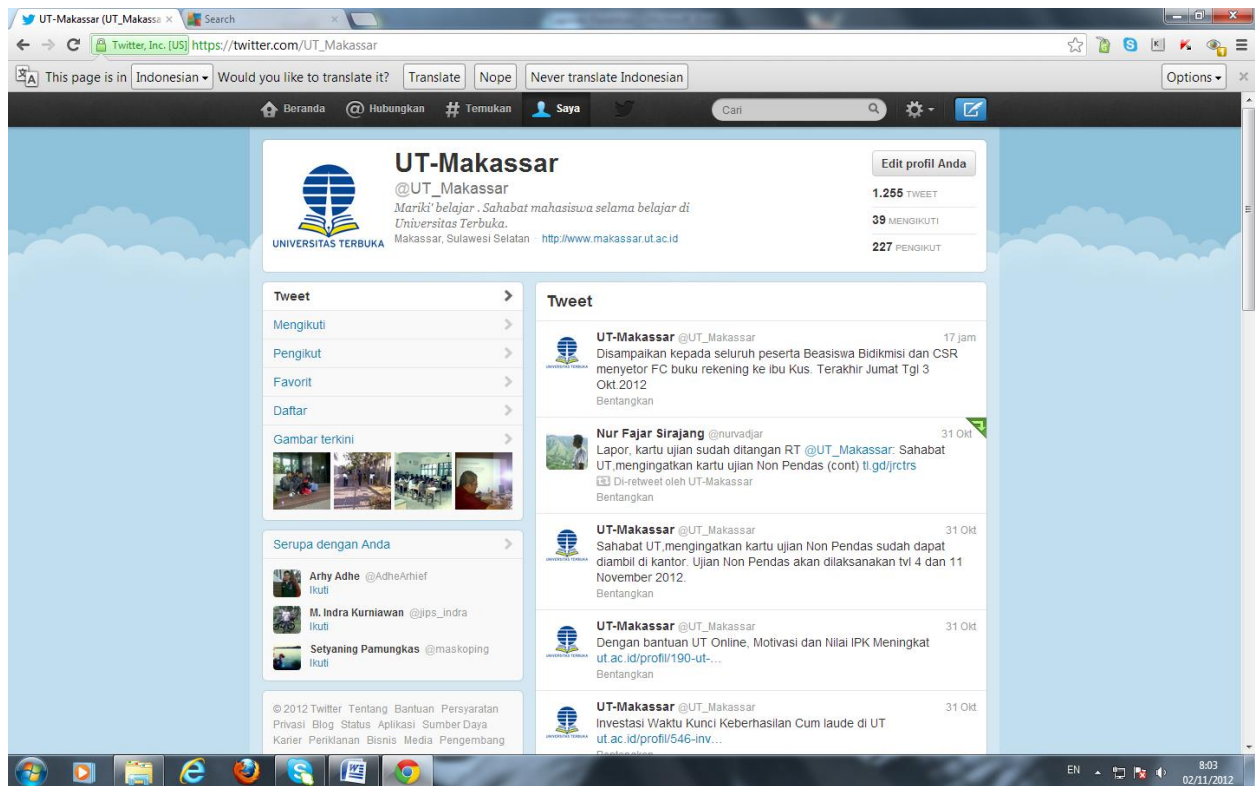
Gambar 4-3. Tampilan Profile Akun Twitter @UT_Makassar