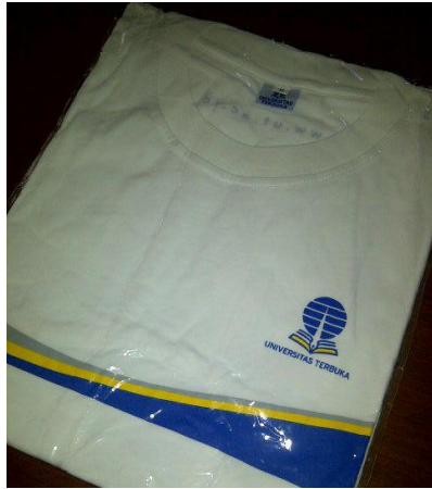
Gambar 4-2. Menarik Perhatian Pengikut @UT_Makassar