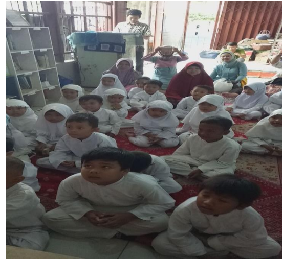
Gambar 5. Implementasi story telling oleh pengelola taman bacaan "Peduli Bangsa" Tangerang Selatan.

Setelah para pengelola memperoleh pembekalan serta praktik mengenai mitigasi kebencanaan melalui story telling selanjutnya dipilih taman bacaan yang paling representative untuk menyampaikan materi mitigasi kebencanaan pada anak -anak.