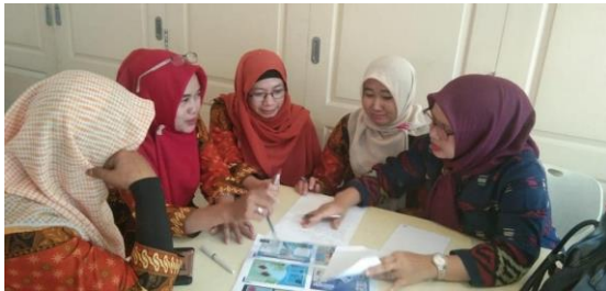
Gambar 4. Praktik mengkonsep mitigasi kebencanaan oleh kelompok pengelola TBM

Tahap berikutnya dari ke 30 pengelola taman bacaan masyarakat (TBM) dibagi mejadi 6 kelompok, dimana masing -masing kelompok terdiri dari 5 orang untuk memperagakan story telling dengan tema mitigasi kebencanaan. Mengingat audiens nantinya adalah anak-anak tema yang dipilih untuk disampkan sesuai usia anak-anak, yaitu mengenai penghijauan, membuang sampah pada tempatnya sebagai upaya menghindarkan banjir yang terjadi di lingkungannya.