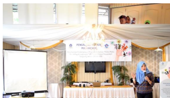
Gambar 3: pembekalan story telling oleh praktisi