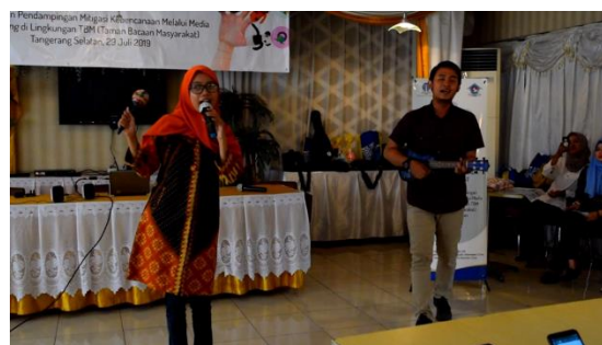
Gambar 2: pembekalan story telling oleh para praktisi

Pemberian contoh mitigasi kebencanaan secara story telling , dilakukan oleh para praktisi yang sudah berpengalaman dalam menyampaikan story telling pada anak-anak. Pada sesi ini peserta yang terdiri pengelola taman bacaan masyarakat akan belajar tatacara mengenai ekspresi wajah, olah tubuh, intonasi pada saat menyampaikan materi pada anak-anak dengan cara story telling .