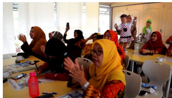
Gambar 1: pembekalan materi mitigasi kebencanaan kepada pengelola TBM

Pemberian materi mitigasi kebencanaan, pengelola taman bacaan diberikan pembekalan mengenai materi mitigasi kebencanaan dan cara menyampaikannya dengan story telling . Pada sesi ini peserta yang terdiri dari pengelola taman bacaan masyarakat (TBM) yang berada di wilayah Tangerang Selatan dilatih dalam menyampaikan materi mitigasi kebencanaan sesuai versi usia anak-anak dalam bentuk story telling .