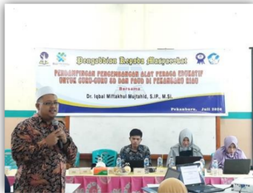
Gambar 2. Pemberian Materi