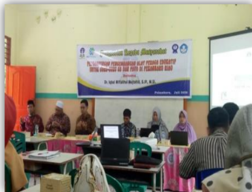
Gambar 3. Pembukaan Kegiatan Pengabdian