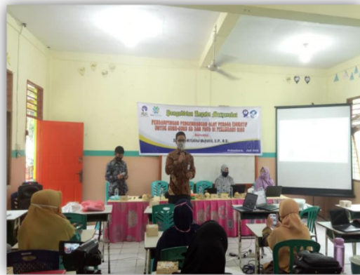
Gambar 1. Pemberian Arahan Pengabdian