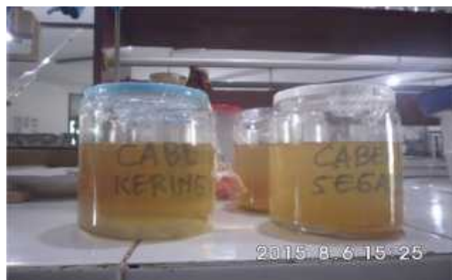
Gambar 1. Minuman Cabe Jawa dari bahan baku Cabe Jawa basah dan kering

Cabe Jawa kering memiliki warna asal agak hitam (Gambar 2b). Warna asal hitam inilah yang diduga turut memberi andil terbentuknya warna minuman yang agak gelap.