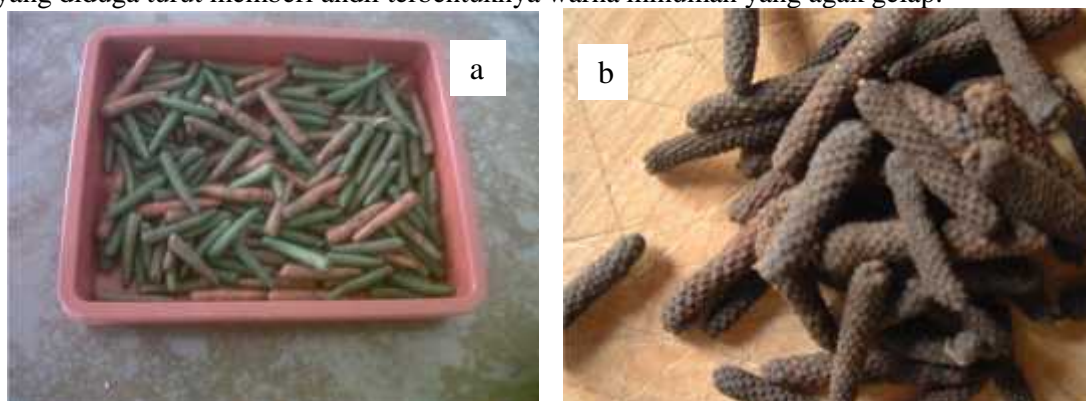
Gambar 2. (a) bahan baku cabe jawa basah, (b) bahan baku cabe jawa kering

Cabe Jawa kering memiliki warna asal agak hitam (Gambar 2b). Warna asal hitam inilah yang diduga turut memberi andil terbentuknya warna minuman yang agak gelap.