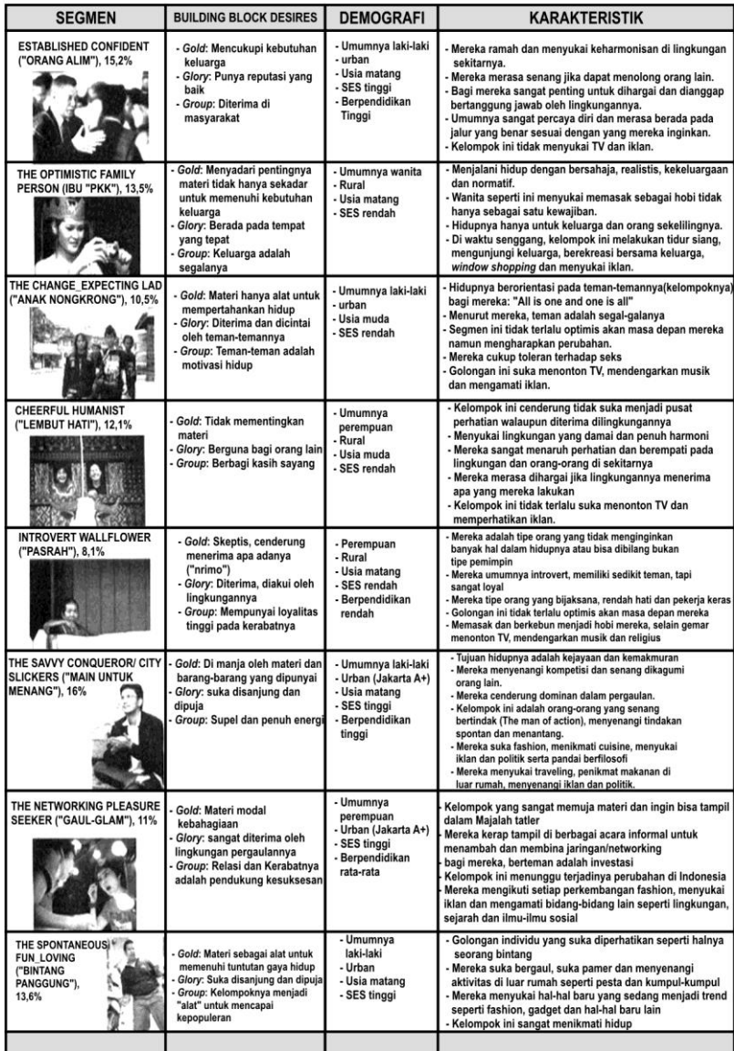
Gambar 1.3. SWA 0600CL17-30 MARET 2006 33