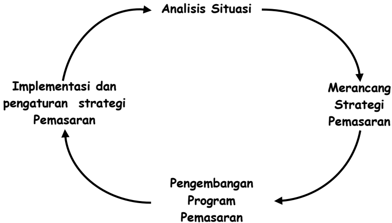
Gambar 1.1. Proses Penyusunan Strategi Pemasaran

Proses strategi pemasaran merupakan suatu siklus yang dapat dilihat pada Gambar 1.1 berikut ini (Cravens 2000):